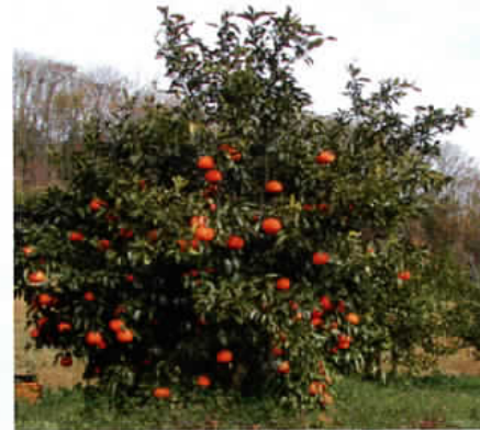
写真1 樹冠上部摘果したはるみ

高接6年生はるみを用い、粗摘果を7月上旬に主枝先端から樹高1/3までの果実を全摘果する区(以下、樹冠上部摘果区)、樹の全面を枝別に摘果をする区(枝別摘果区)、主枝・垂主枝単位に樹の片側の果実1/2程度を全摘果する区(主枝交互摘果区)、を設けた。仕上げ摘果は8月上旬に行い、1 m 3 当たり果数が20~25果程度になるよう実施した。採収は1月上旬に行い、果実品質、収量を調査した。