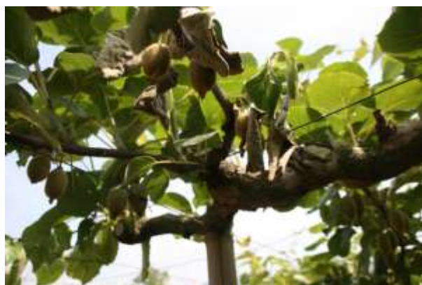
写真1 Psa3 系統による枝枯れ（「Hort16A」）

2014年5月に国内で初めて確認されたキウイフルーツかいよう病( Pseudomonas syringae pv. actinidiae biovar3 : Psa3) は、県下の主要産地でも発生が確認され、今後も発生地域の拡大が懸念される。本病による被害は黄色系品種の「Hort16A」などで大きく、その症状は枯死や枝枯れ等、激しい傾向にあり早急な防除対策の確立が必要である。