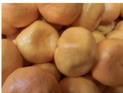
写真 1 浮皮によってコンテナ内で変形した温州ミカン

‘南柑 20 号’は、本県の温州ミカンの栽培面積の約 20%を占めている。近年、浮皮による品質低下が問題となっており、軽減技術の確立が急務となっている。浮皮果は、食味が劣り、選果や輸送中に傷がつきやすいため、市場価値は著しく低下する。成熟期の高温多雨条件下で助長され、また、夏秋期に雨が多く、気温が低いと水分ストレスがかかりにくいために果皮が厚くなって浮皮になりやすいといわれている。