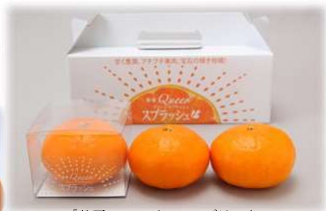
「甘平」のスペシャルブランド (愛媛クィーンズブラッシュ)