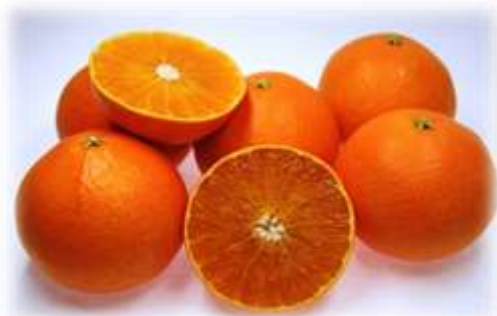
「愛媛果試第 28 号」(紅まどんな)