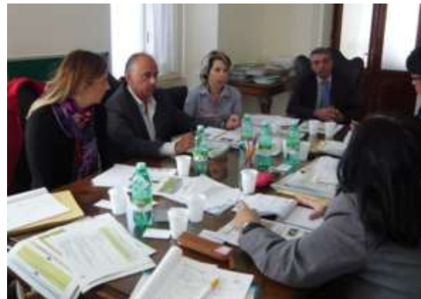
写真2 海外調査（イタリア・農林政策省）の状況

生県と連携して現地発生園の被害状況や発生推移の情報収集、園地内における菌の動態解明（土壌中の菌密度の推移や菌の樹体内分布等）を行ったほか、農林水産省本省関係課等の支援をいただきイタリアにおける現地調査（2014年度農食事業）、海外の Psa3 系統に関する研究論文調査等を実施した。