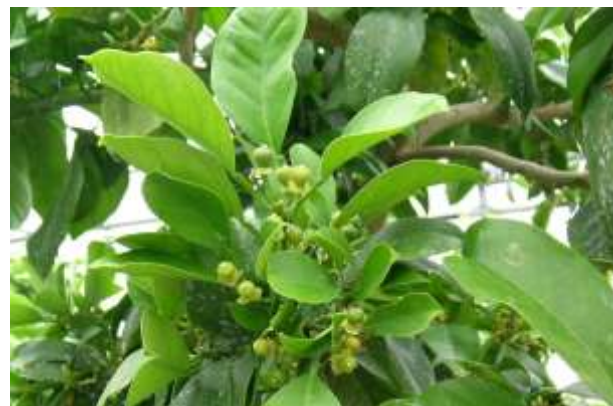
写真1 NAA散布処理3日後の状況