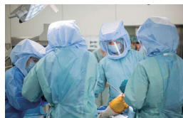
手術風景(整形外科)