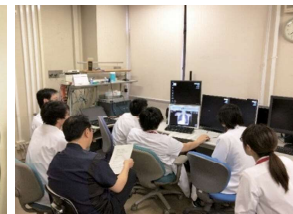
救急明けカンファレンス風景