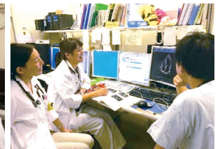
心臓超音波カンファレンス風景