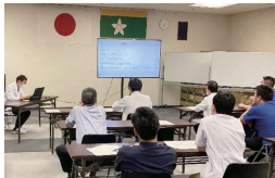
臨床研修症例報告会の様子

【診療科】内科／呼吸器内科／循環器内科／消化器内科／血液内科 糖尿病・内分泌内科／脳神経内科／小児科／外科 消化器外科／整形外科／脳神経外科／心臓血管外科 皮膚科／泌尿器科／産婦人科／耳鼻咽喉科／放射線科 麻酔科／リハビリテーション科 (休診中：心療内科／眼科／精神科)