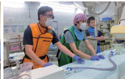
心臓カテーテルシミュレータ実習の様子