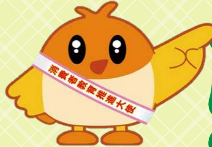
愛媛県消費生活相談窓口 イメージキャラクター こまどりのPiPi (ピピ)