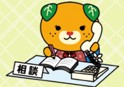
愛媛県 イメージアップキャラクター みきゃん