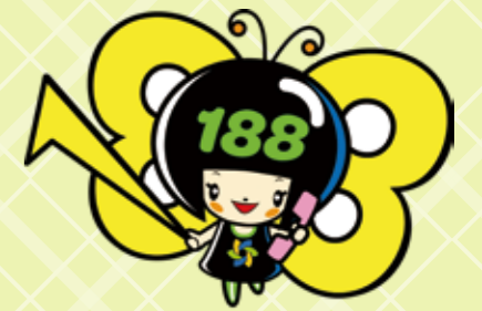
消費者庁 消費者ホットライン イメージキャラクター イヤヤン