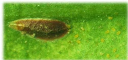
雌成虫と孵化幼虫(体色黄色)

ヤノカイガラムシの薬剤防除適期は、 第1世代は、第1世代幼虫初発日の30~35日後(アブロード剤、モベントフロアブルは20~25日後) です。 第2世代は、第2世代幼虫初発日の30日後頃 です。