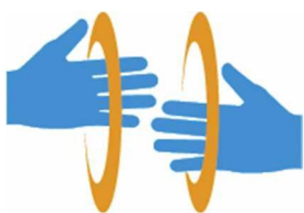
【手話マーク】 所管：一般財団法人全日本ろうあ連盟