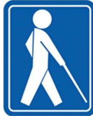
【盲人のための国際シンボルマーク】 所管：社会福祉法人日本盲人福祉委員会