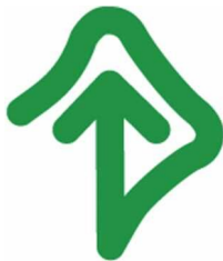
【耳マーク】 所管：一般社団法人全日本難聴者・中途失聴者団体連合会