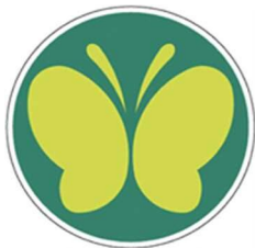
【聴覚障害者標識 (聴覚障害者マーク)】 所管：警察庁