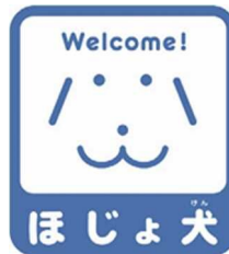
【ほじょ犬マーク】 所管：厚生労働省