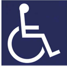
【障害者のための国際シンボルマーク】 所管：公益財団法人日本障害者リハビリテーション協会