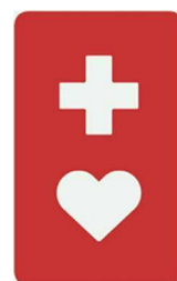
【ヘルプマーク】 所管：東京都