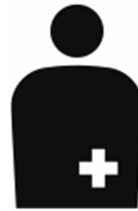
【オストメイト用設備/オストメイト】 所管：公益財団法人 交通エコロジー・モビリティ財団