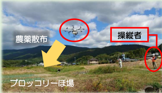
ブロッコリーほ場 ドローンを使った農薬散布の様子 (R5.10.21)