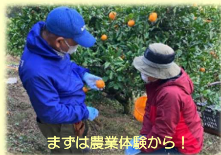
まずは農業体験から！

具体的には、農業未経験の方を対象とした農業体験や、 親方農家と連携した年間を通じた研修受入 など、新たに農業を志す人がスムーズに就農できるように支援しています。