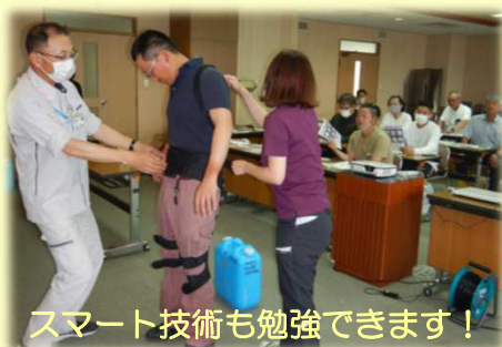
スマート技術も勉強できます！