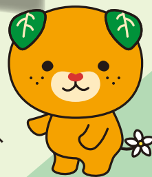
愛媛県イメージアップ キャラクター「みきゃん」