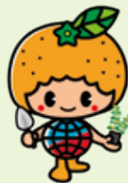
地球温暖化防止キャラクター 「ストッピー」