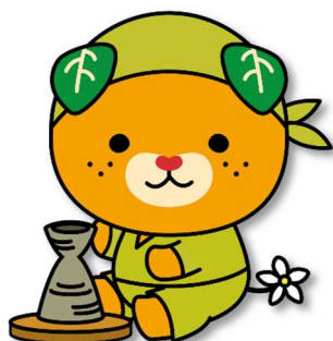
愛媛県イメージアップキャラクター みきゃん