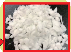
ペットボトルのキャップなどの廃プラスチックとリサイクル材。