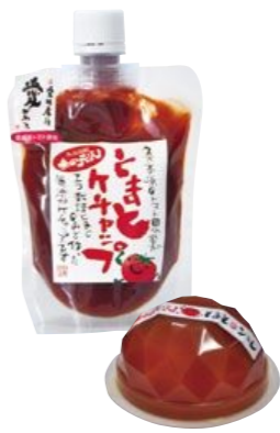
新商品のケチャップやジュレ

また、レストランや旅館で料理の材料として使っていたり、ケチャップやジュレなどの商品化にも取り組んでいるので、 今後は料理の材料としての可能性も伸ばしたい と思っています。