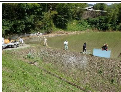
センチピードグラス吹き付け作業