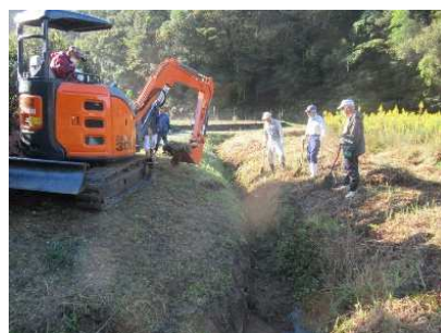
共同活動 (水路の泥上げ)