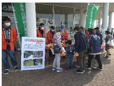
道の駅での販売促進活動