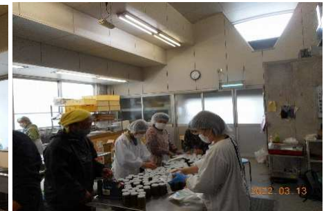
加工品製造の様子