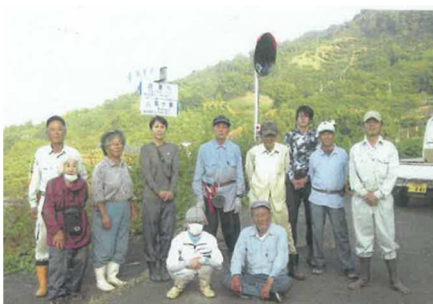
共同作業従事者(一部)