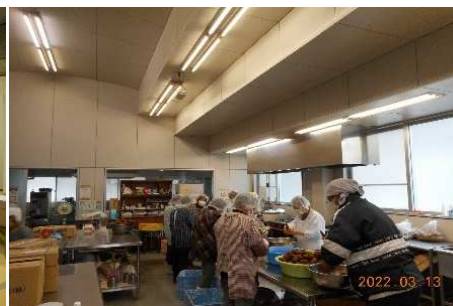
加工品製造の様子