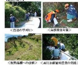
活動紹介ポスター