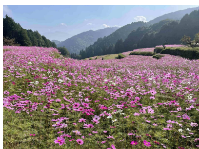
協定農用地のコスモス

課題・展望 ■ 参加者の高齢化が進んでいるため、法面や水路・農道等の管理が難しくなっている。 ■ 有害鳥獣による農作物被害が増加しているため、被害対策を推進する。