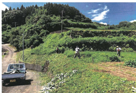
農地周辺等の草刈り