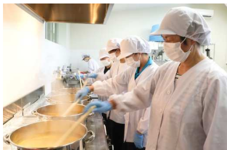
マーマレード加工の様子