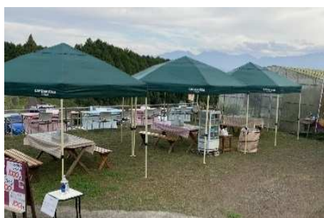
地元食材を提供するスペース