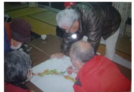
集落戦略の地図を用いた話し合い