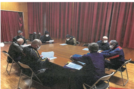
集落での話し合い