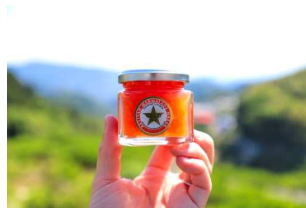
金賞受賞のマーマレード