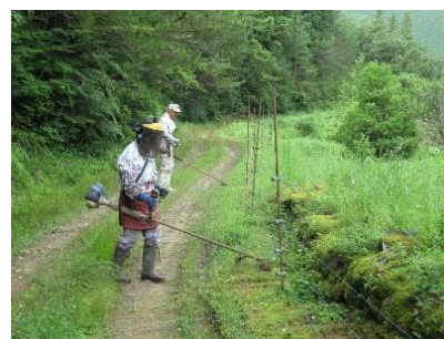
農道・水路の管理