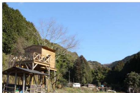
ツリーハウスもあるぼんぼこ農園