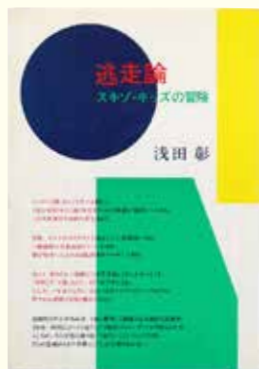
浅田彰「逃走論」 1984年 筑摩書房 装幀：原田治