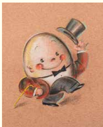
HUMPTY DUMPTY (OSAMU GOODS用原画) 1970年代後半-1980年前半