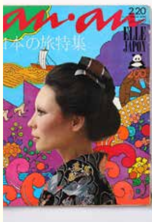
ショップバッグvol.47 (OSAMU GOODS*) 1989年 ©Osamu Harada / Koji Honpo