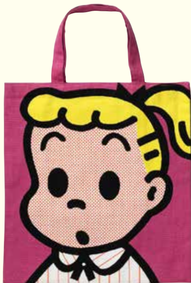
スクールバッグ (OSAMU GOODS*) 1992年 ©Osamu Harada / Koji Honpo