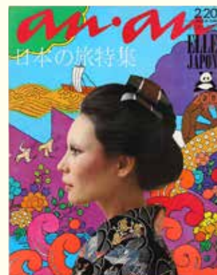
「an·an」第47号 1972年 平凡出版 アートディレクション：堀内誠一 表紙イラストレーション：原田治