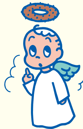
ミスタードーナツ キャンペーン用キャラクター 1986年