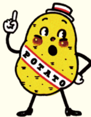
カルビー「ポテトチップス」など マスコットキャラクター 1976年 作：原田治