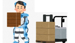
荷役作業の時間や身体負担を減らす機器等の導入