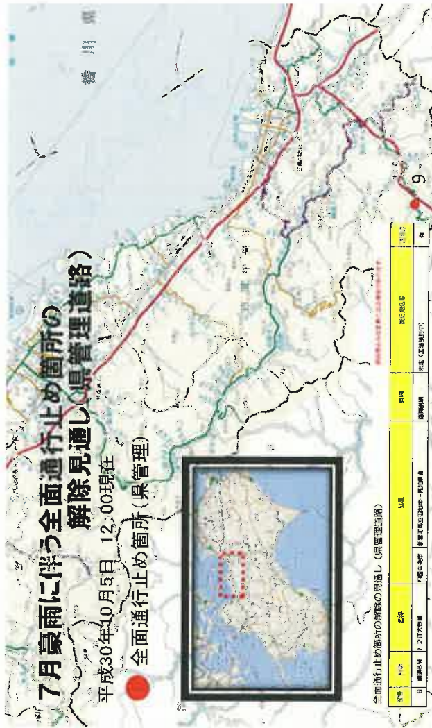
全面通行止め箇所の解除の見通し(県管理道路)