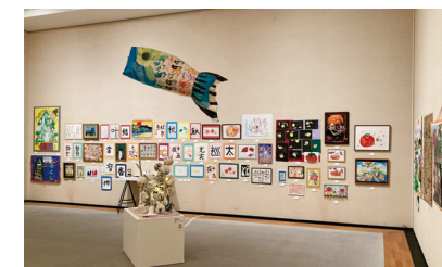
愛顔ひろがるえひめの障がい者アート展