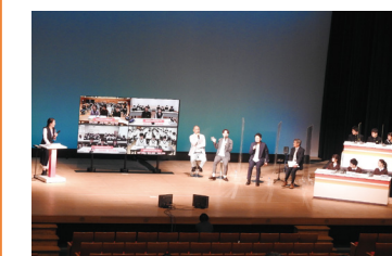
県内一斉ライブ授業 えひめいじめSTOP! デイ