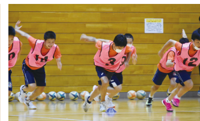
えひめ愛顔のジュニアアスリート発掘事業