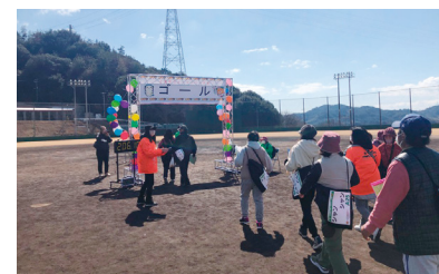
ウォークラリー(ねりんピック種目)

年齢や障がいの有無等を問わず、働く意欲の高い方々が働きやすい職場環境づくりを進めるとともに、地域社会への貢献など、様々な場所で活躍できる環境を整備します。また、健康寿命を延ばす取組みを進めるほか、生涯にわたって身近にスポーツや文化芸術活動などに親しむことができる環境整備を進め、仕事や家庭以外に余暇時間を豊かに過ごしながら、自分の能力を発揮して活躍できる社会を目指します。