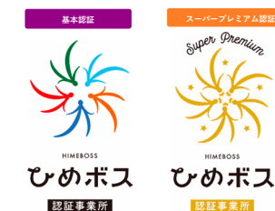
女性活躍の推進や仕事と家庭の両立支援などに積極的に取り組む事業所を県が認証

愛媛で就職し、結婚・出産の希望を叶え、安心して子育てを行い、仕事と家庭の両立ができる環境を整えていくほか、地元に対する想いを行動で表すシビックプライドの醸成や、本県の魅力発信の促進、交流の拡充により、更なる愛媛ファンを獲得し、関係人口の増加を図ります。