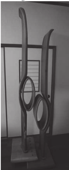
作品名：オブジェ 「森の私語（ささやき）」

木工業に従事し日々技能の研鑽に励むことで、家具・建具製造に関する卓越した技能を身に付けた。