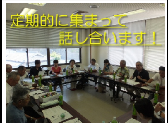
活動前の打ち合わせの様子