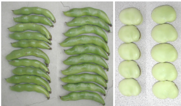
「愛のそら」の莢と青実