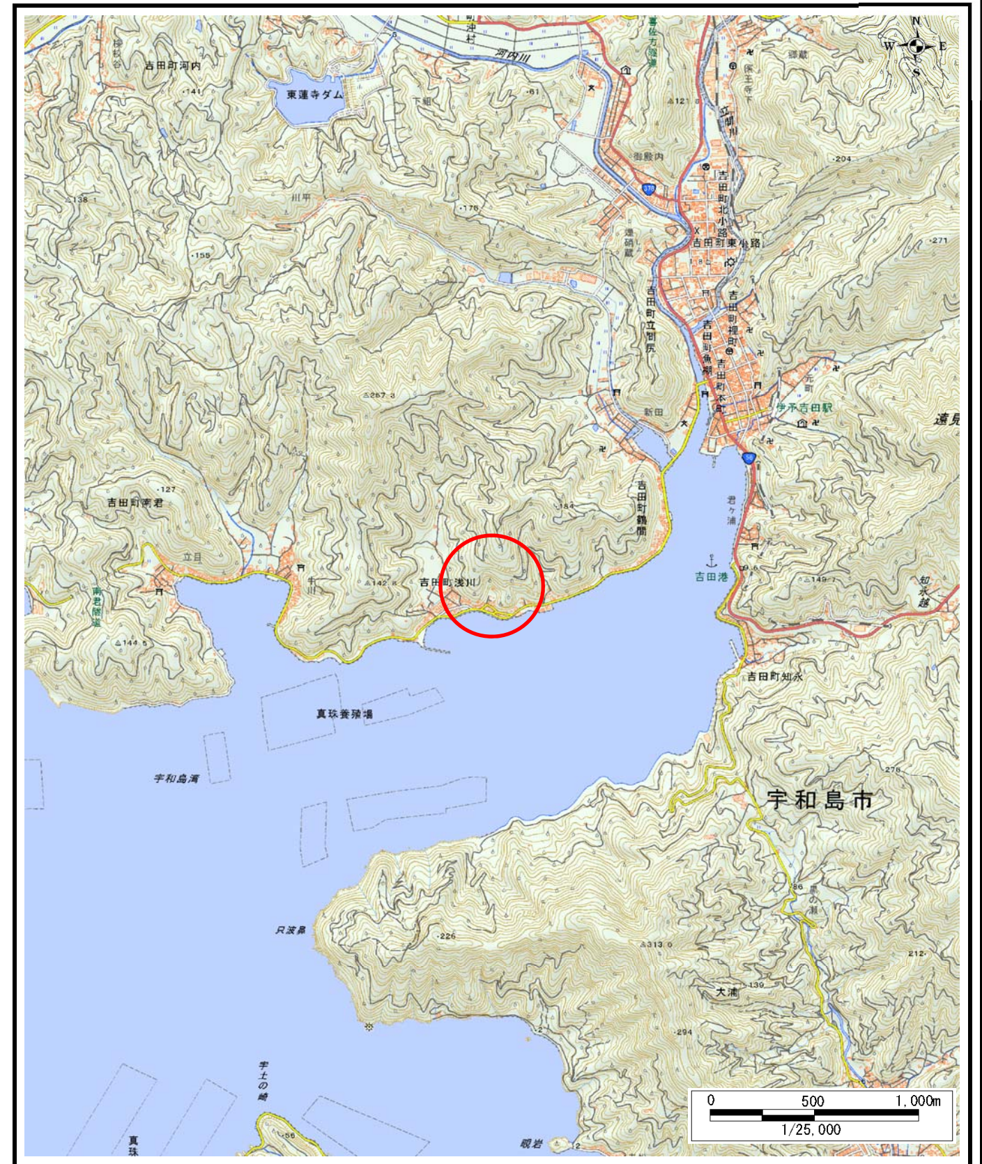
様式-1 (土) 土砂災害警戒区域・土砂災害特別警戒区域 位置図