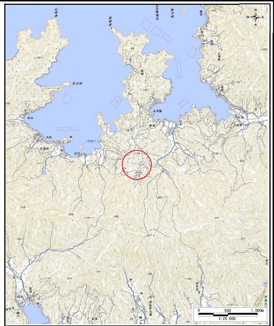
様式-1 (土) 土砂災害警戒区域・土砂災害特別警戒区域 位置図