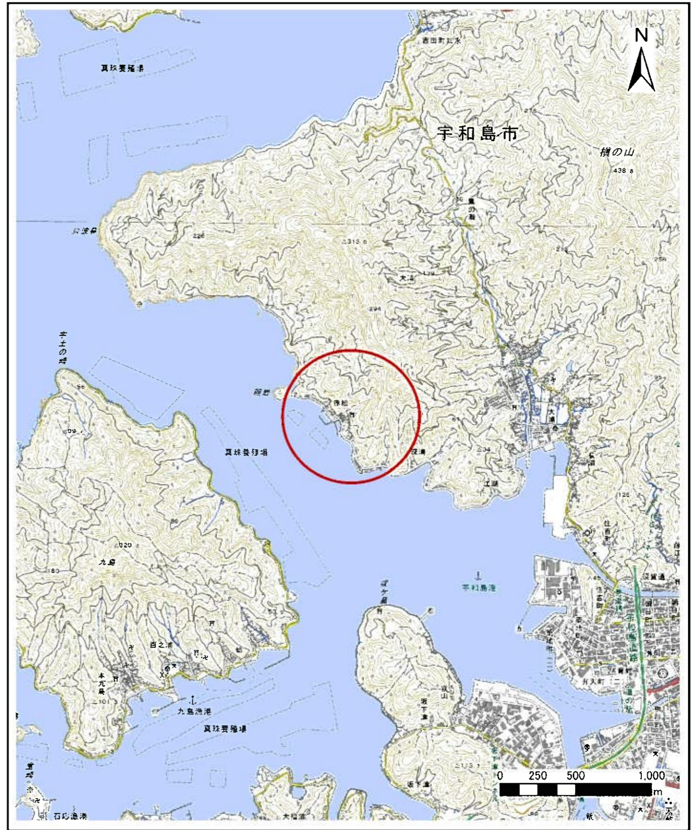
様式-1 (土) 土砂災害警戒区域・特別警戒区域 位置図