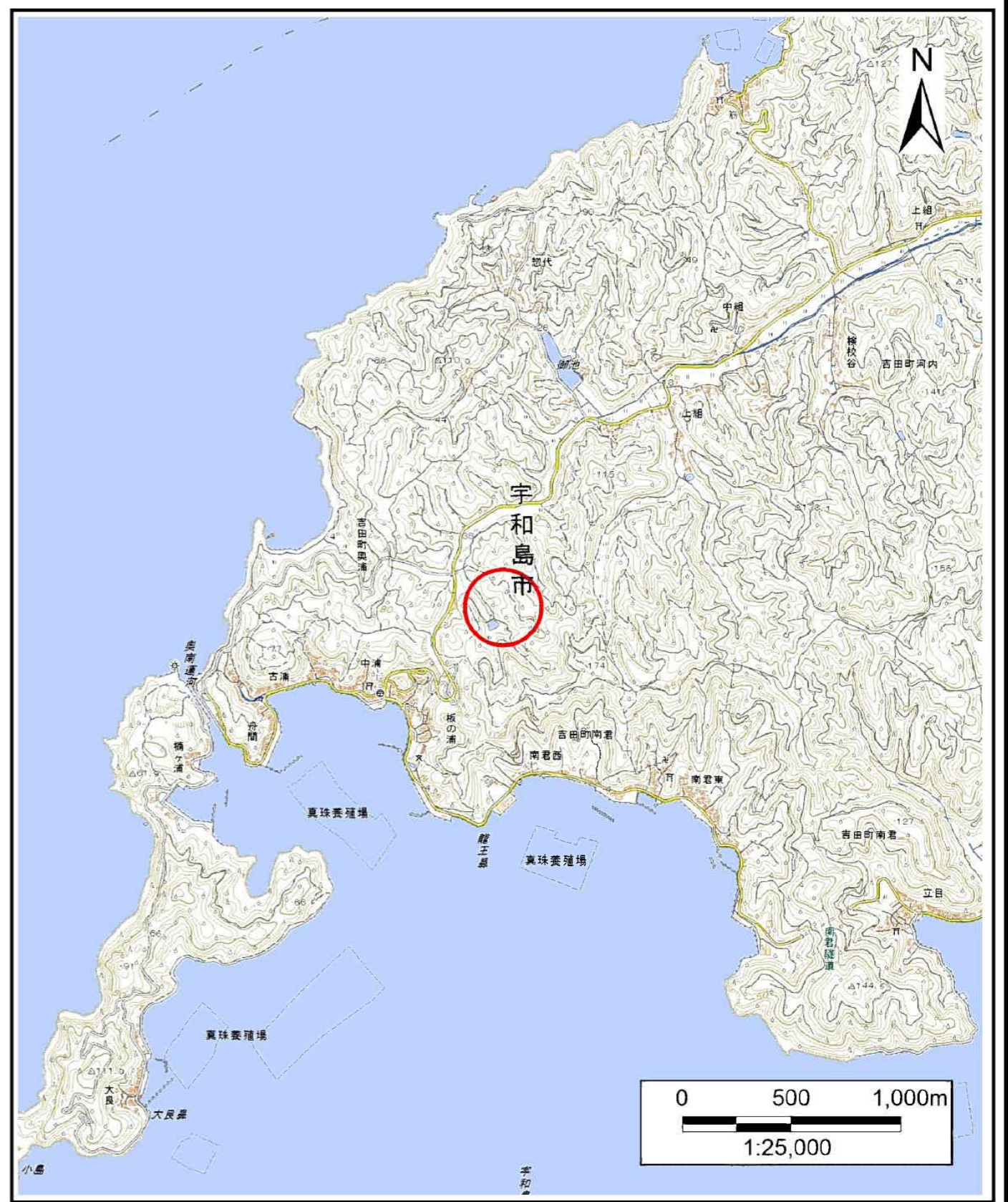
様式-1 (土) 土砂災害警戒区域・土砂災害特別警戒区域 位置図