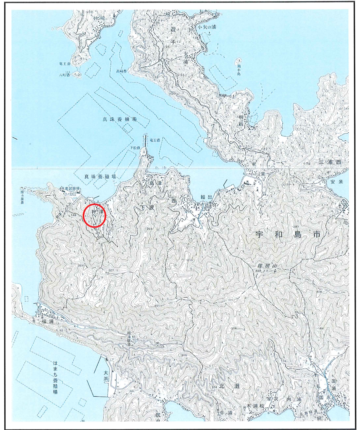
様式-1 (土) 土砂災害警戒区域・土砂災害特別警戒区域 位置図