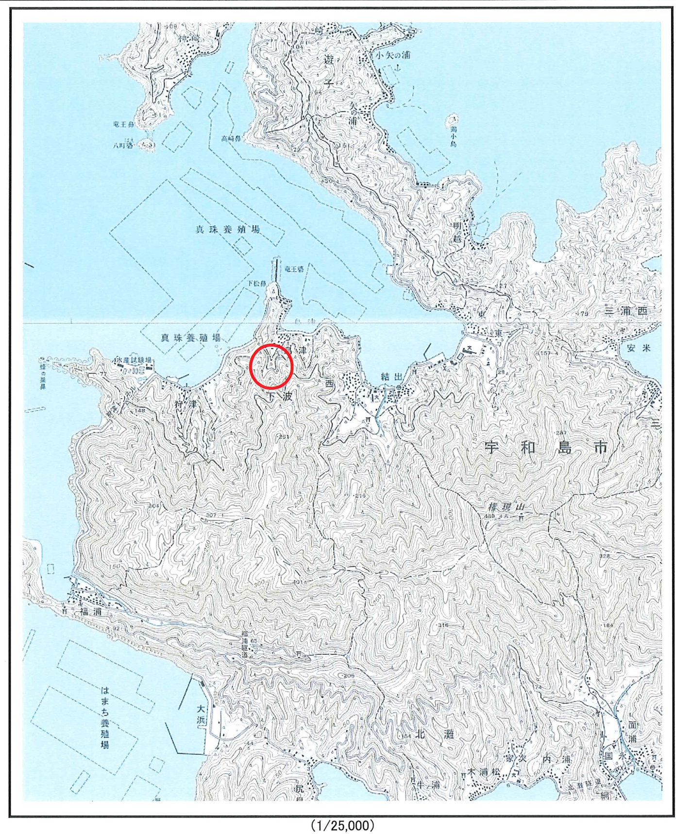
様式-1 (土) 土砂災害警戒区域・土砂災害特別警戒区域 位置図