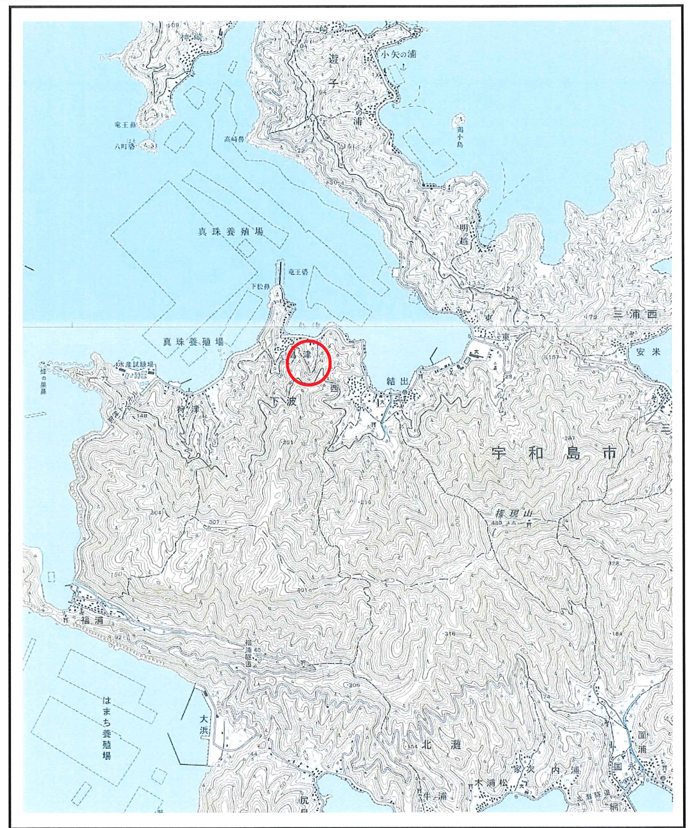
様式-1 (土) 土砂災害警戒区域・土砂災害特別警戒区域 位置図