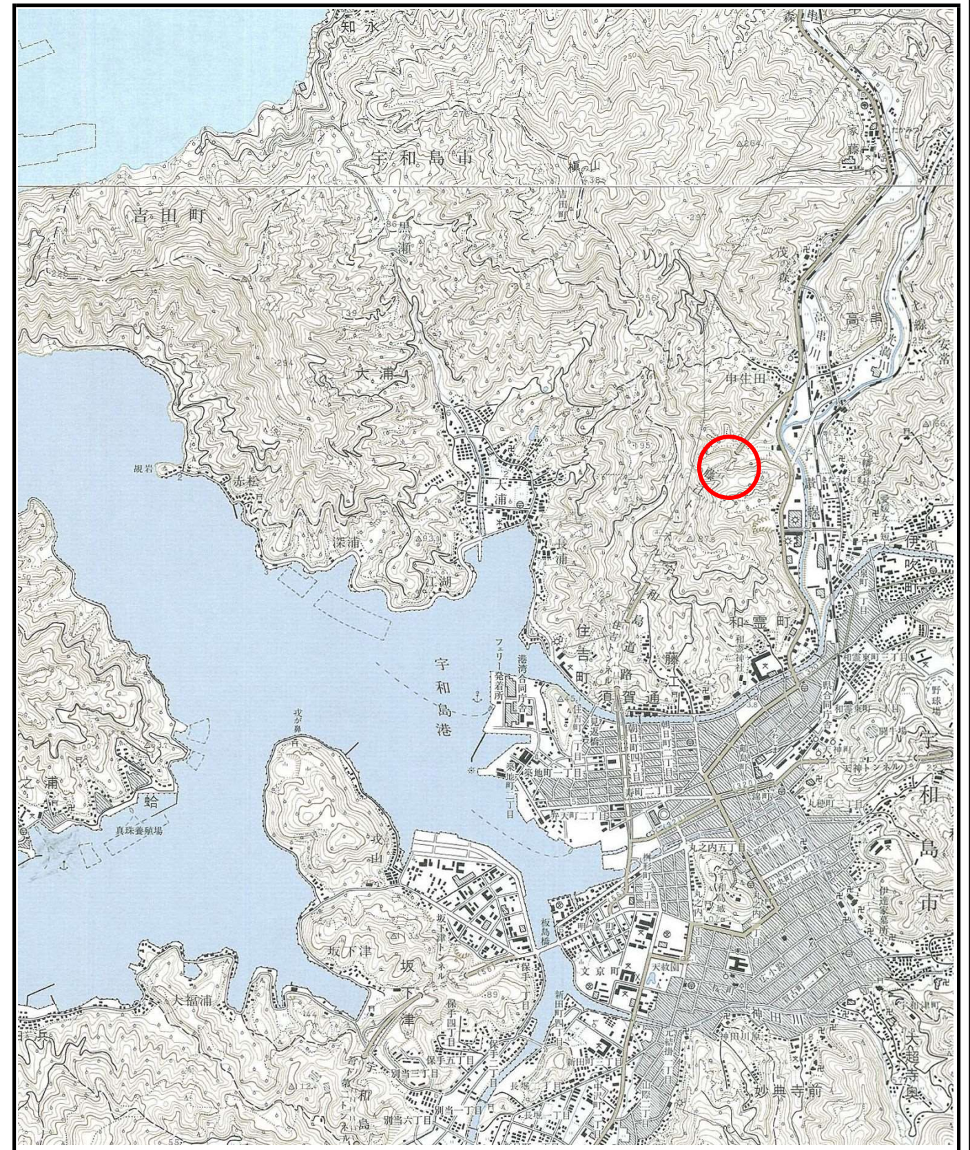
様式-1 (土) 土砂災害警戒区域・土砂災害特別警戒区域 位置図