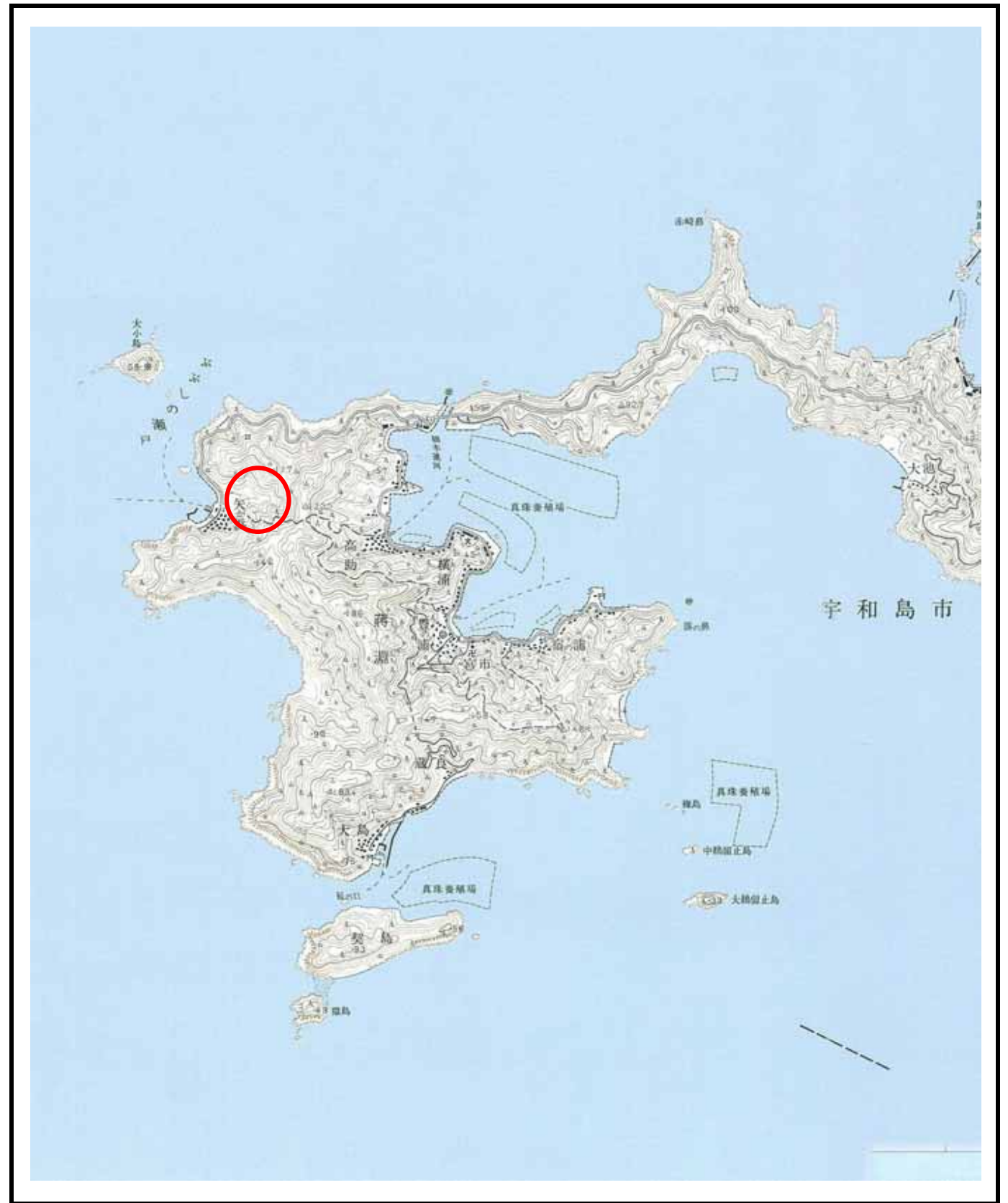
様式 - 1 (土) 土砂災害警戒区域・土砂災害特別警戒区域 位置図