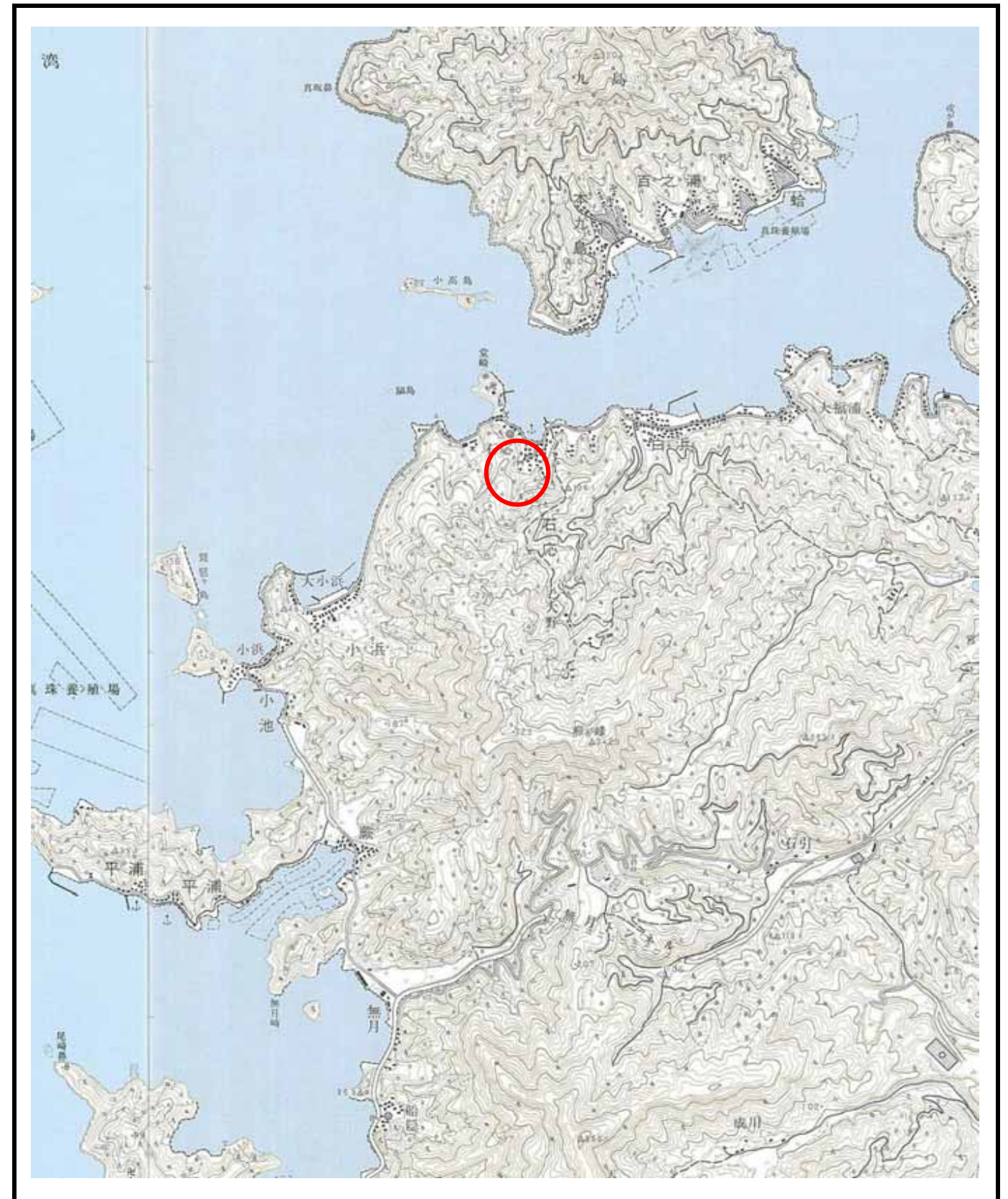
様式 - 1 (土) 土砂災害警戒区域・土砂災害特別警戒区域 位置図