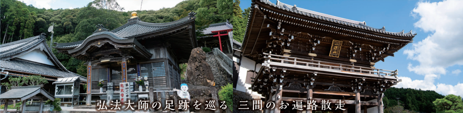
弘法大師の足跡を巡る 三間のお遍路散走