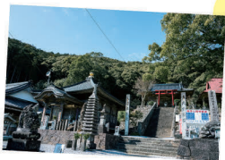
龍光寺の本堂と 稲荷神社