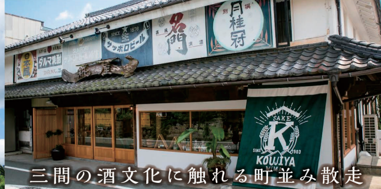
三間の酒文化に触れる町並み散走