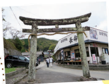
山門ではなく 鳥居