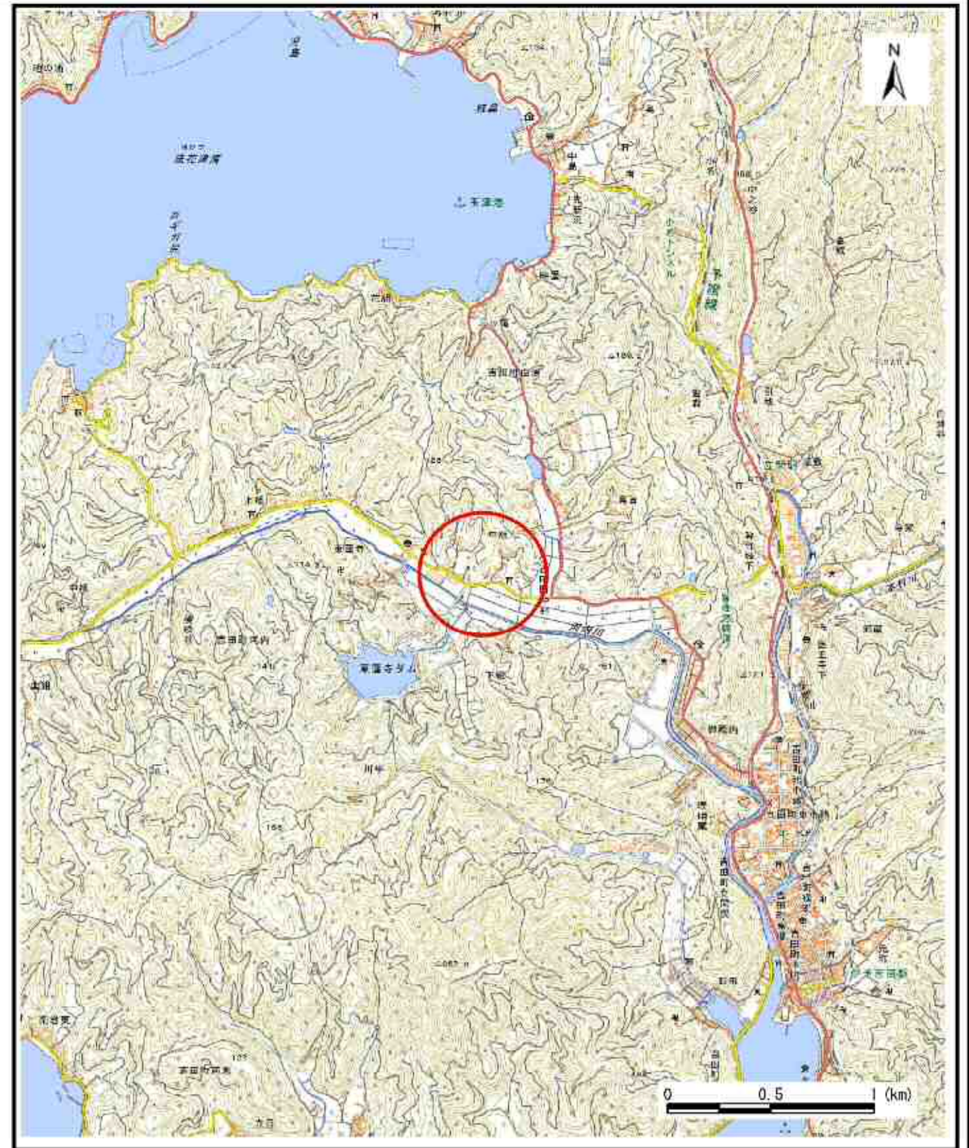
様式-1 (急) 土砂災害警戒区域・土砂災害特別警戒区域 位置図