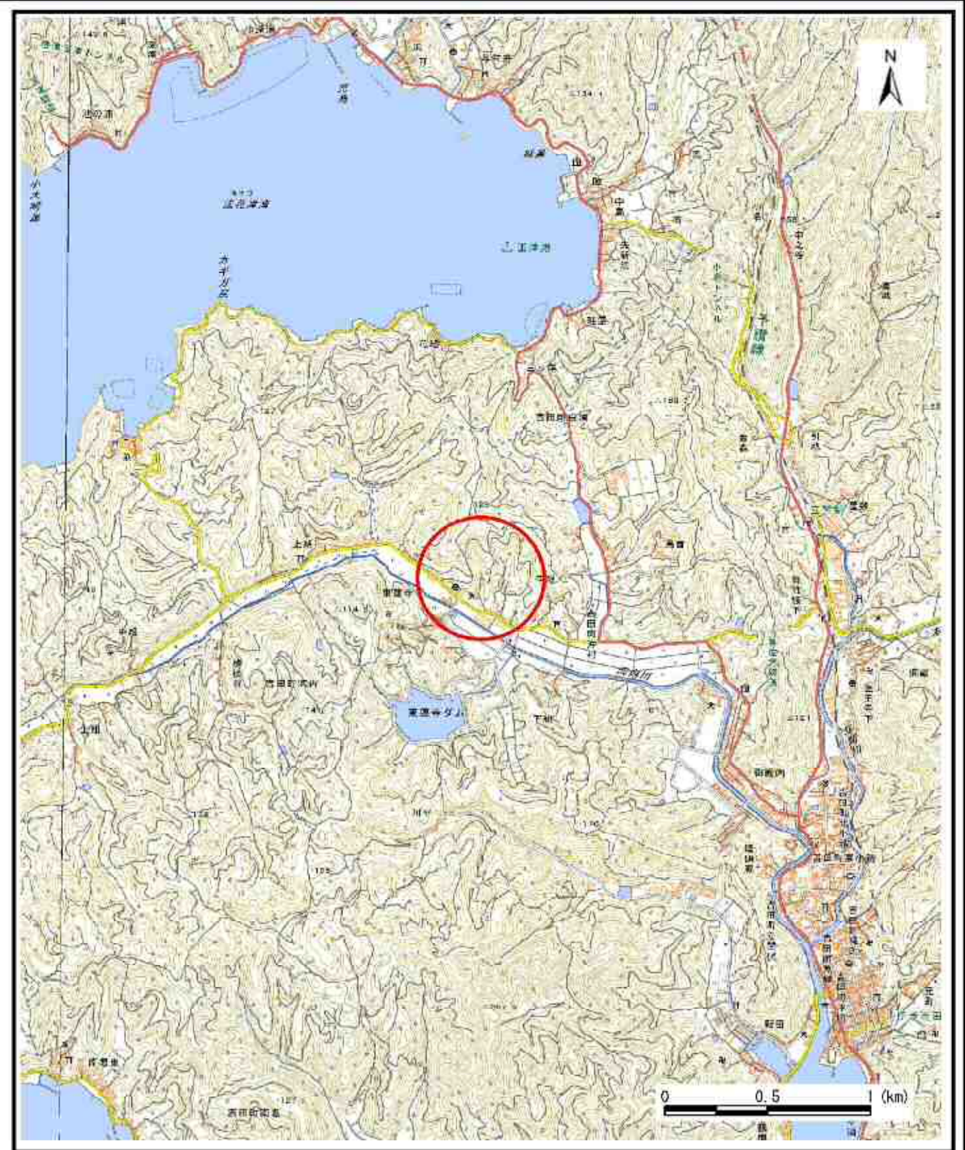
様式-1 (急) 土砂災害警戒区域・土砂災害特別警戒区域 位置図