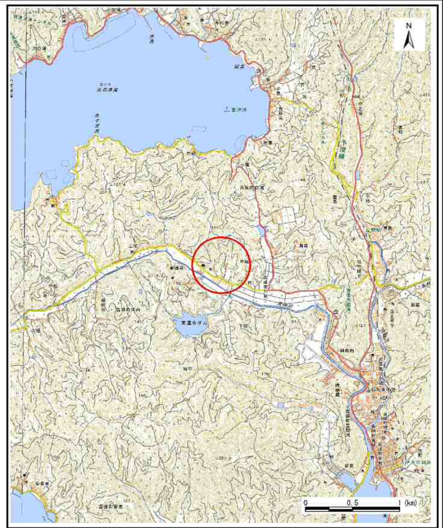
様式-1 (急) 土砂災害警戒区域・土砂災害特別警戒区域 位置図