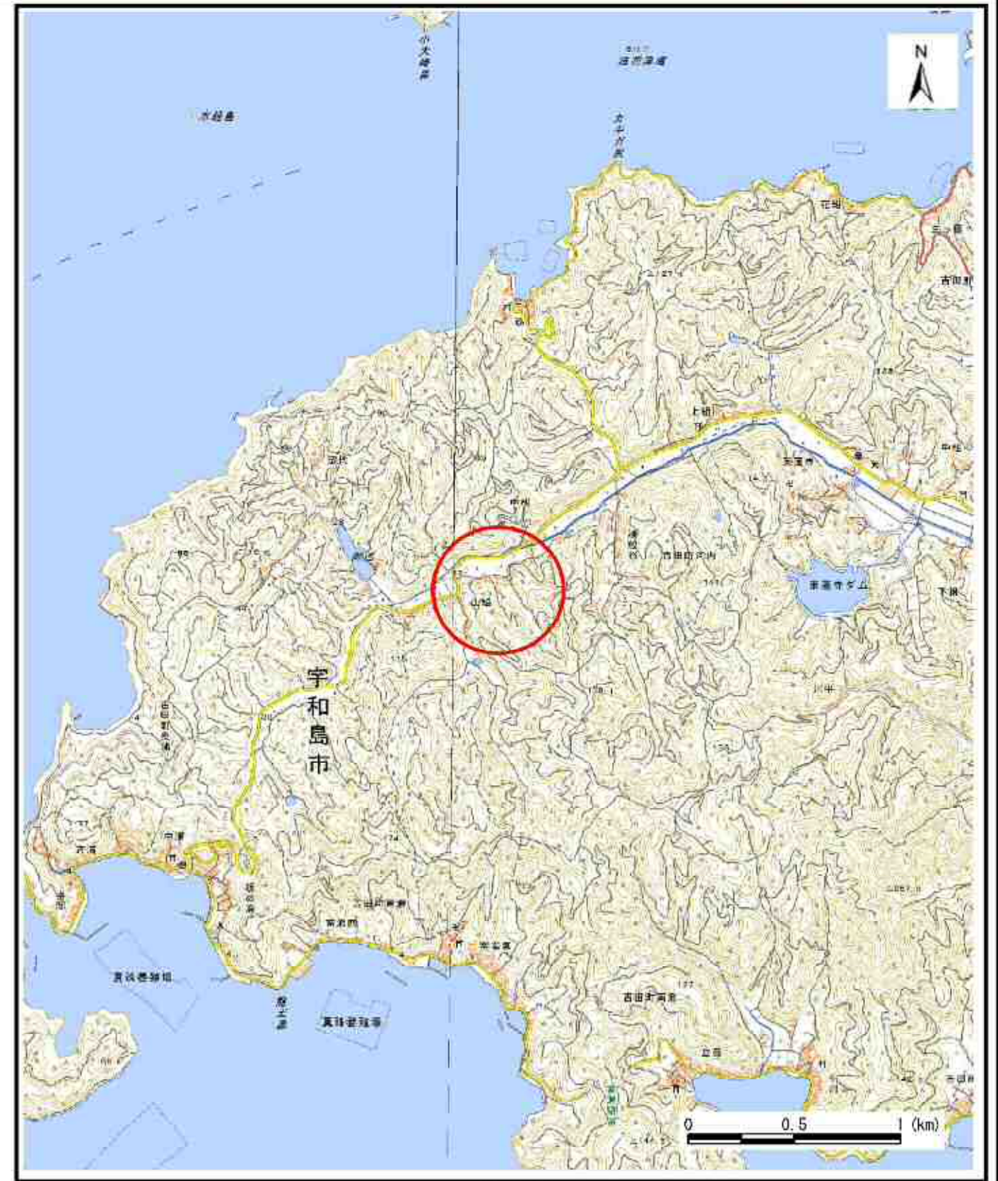
様式-1 (急) 土砂災害警戒区域・土砂災害特別警戒区域 位置図