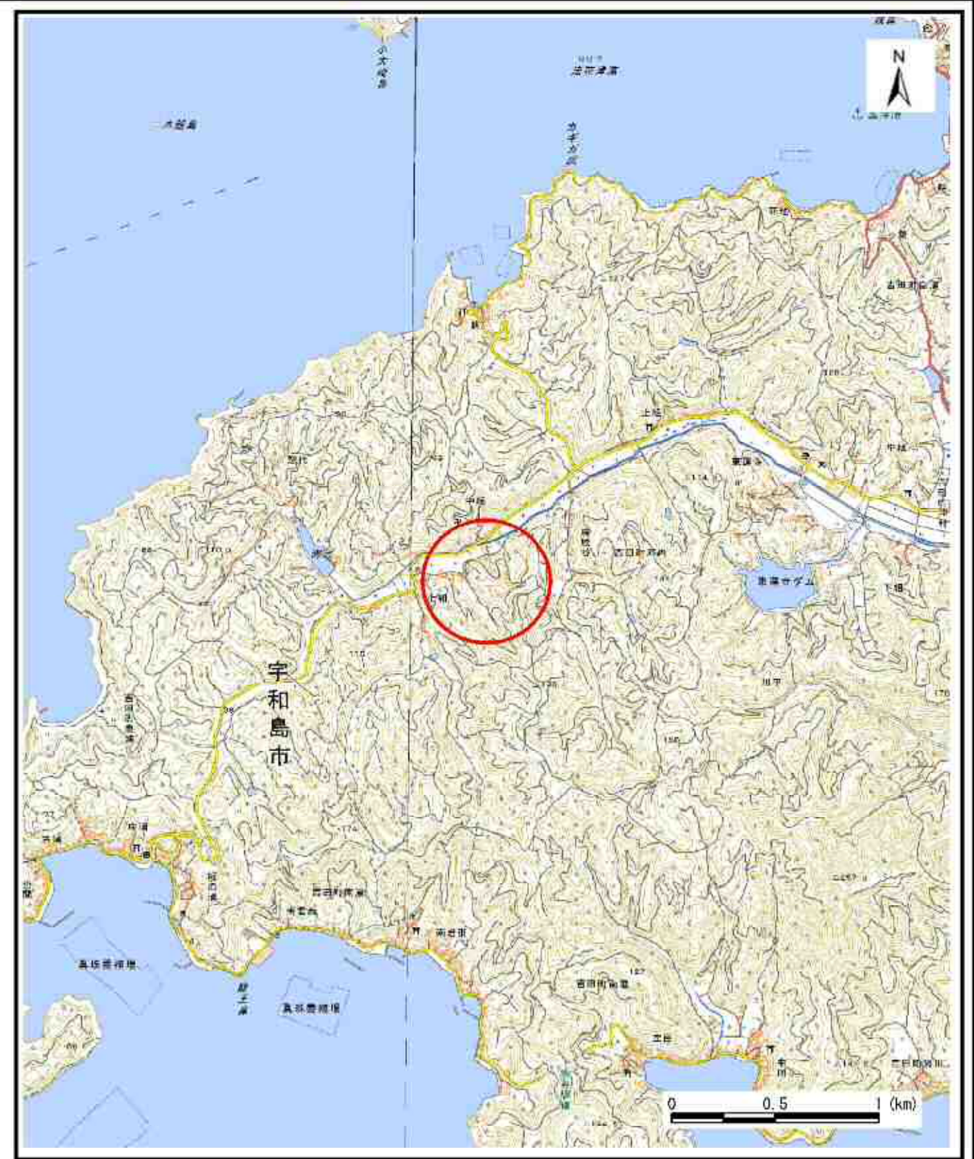
様式-1（急） 土砂災害警戒区域・土砂災害特別警戒区域 位置図