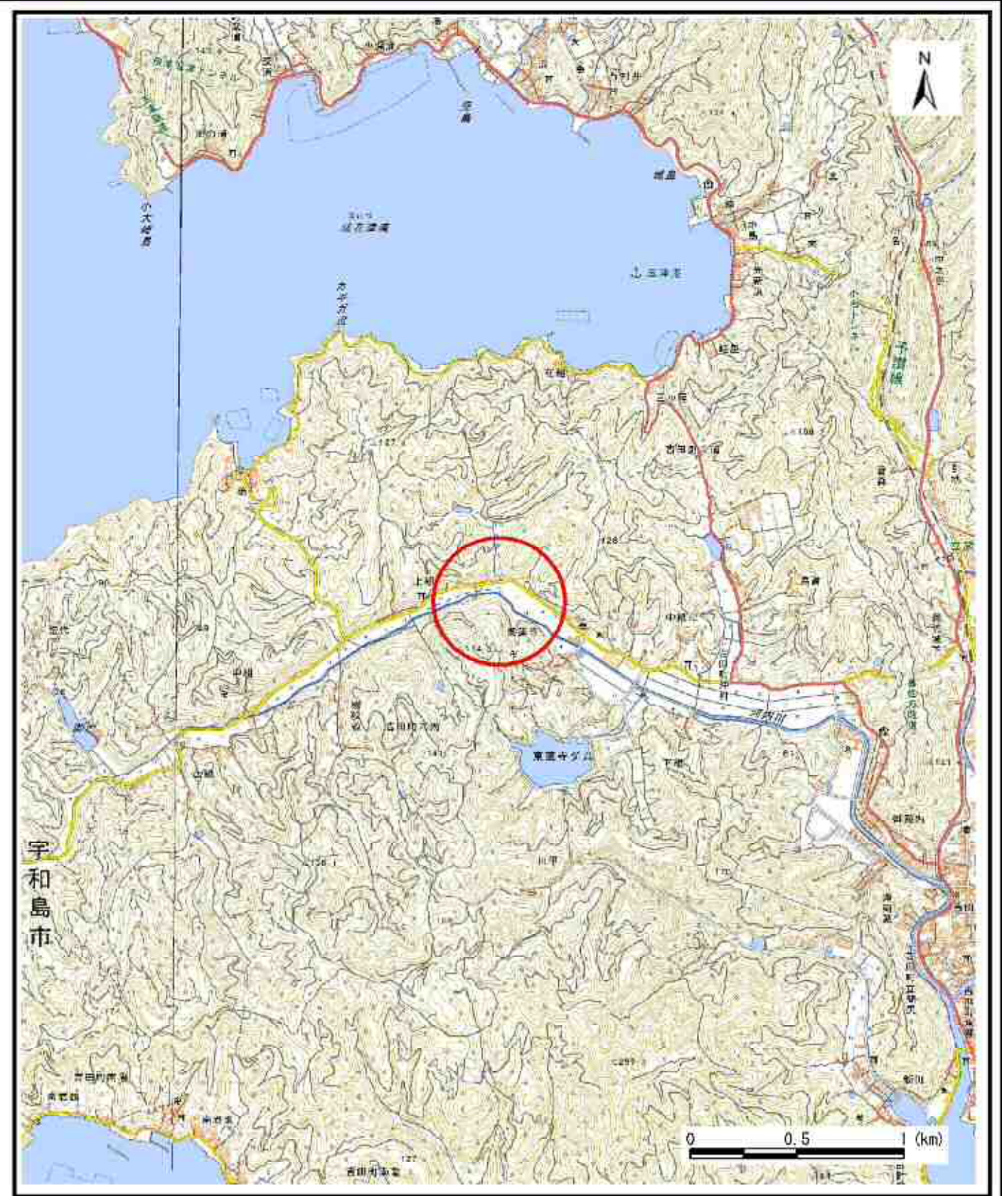
様式-1 (急) 土砂災害警戒区域・土砂災害特別警戒区域 位置図