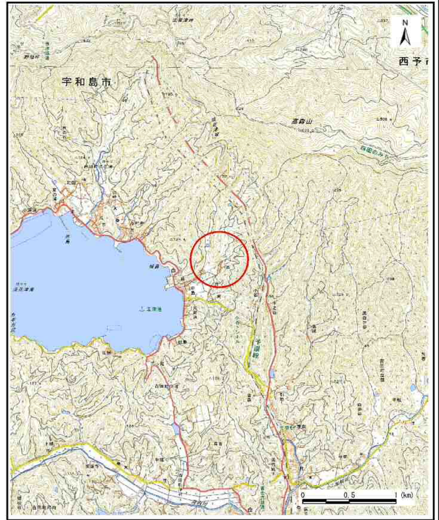
様式-1 (急) 土砂災害警戒区域・土砂災害特別警戒区域 位置図