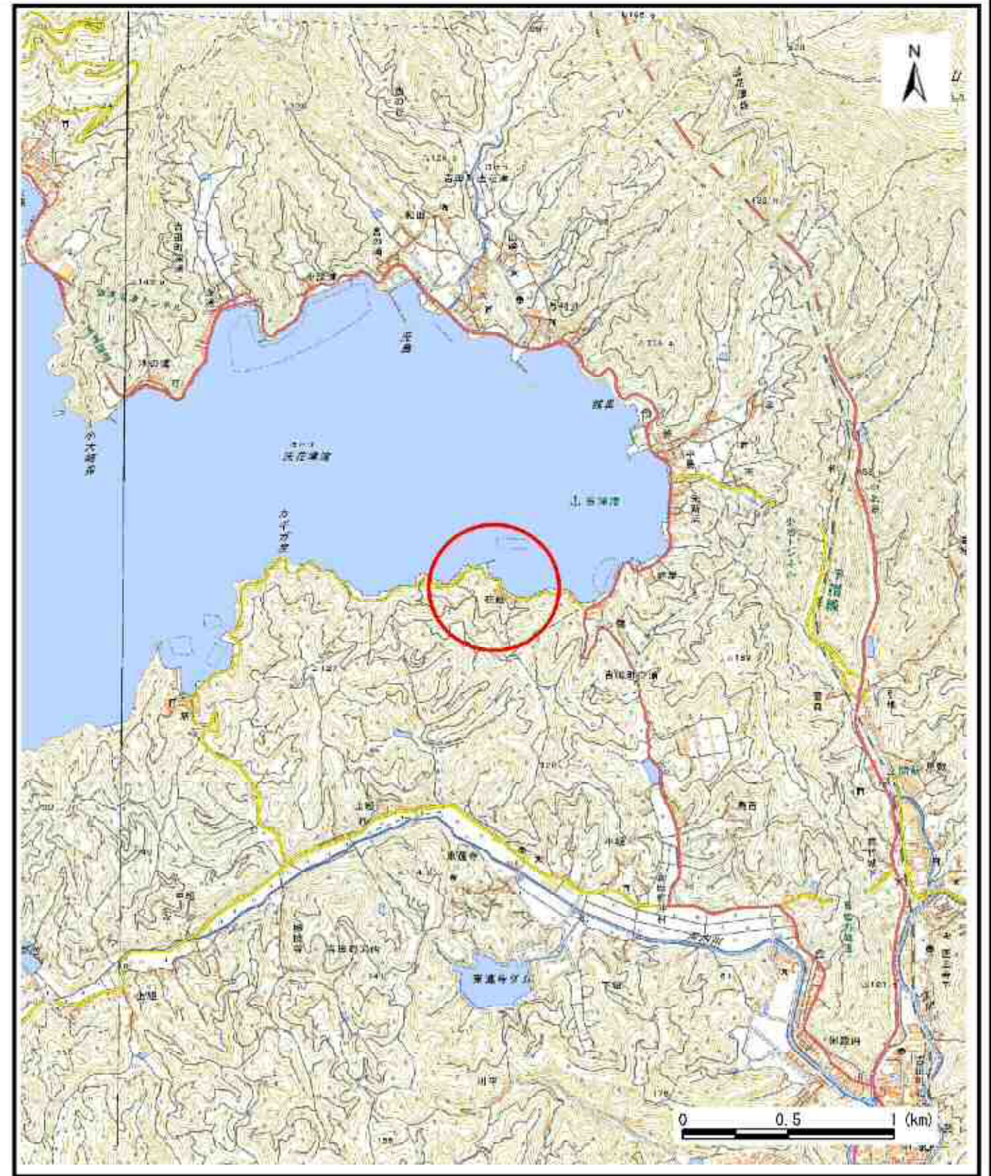
様式-1 (急) 土砂災害警戒区域・土砂災害特別警戒区域 位置図