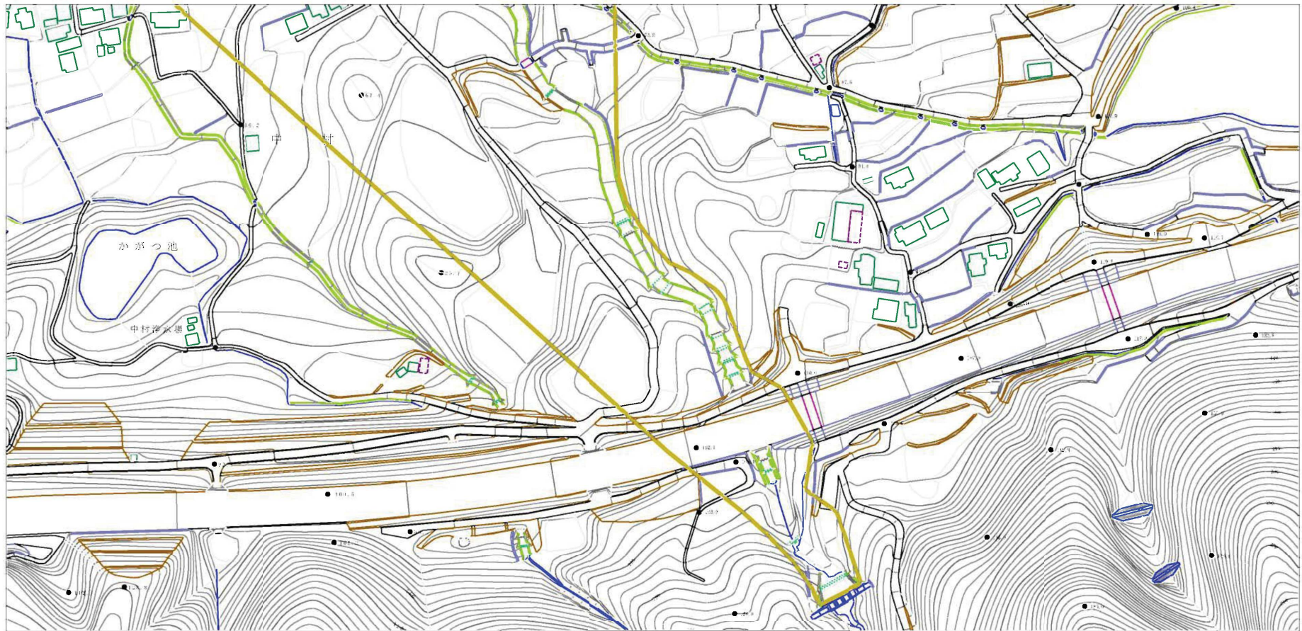
上図は平成25年10月15日付け愛媛県告示第1123号に基づく土砂災害(特別)警戒区域について、令和 年 月 日付けで土砂災害特別警戒区域を解除(告示第 号)した後の区域を表す。