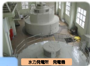
水力発電所 発電機