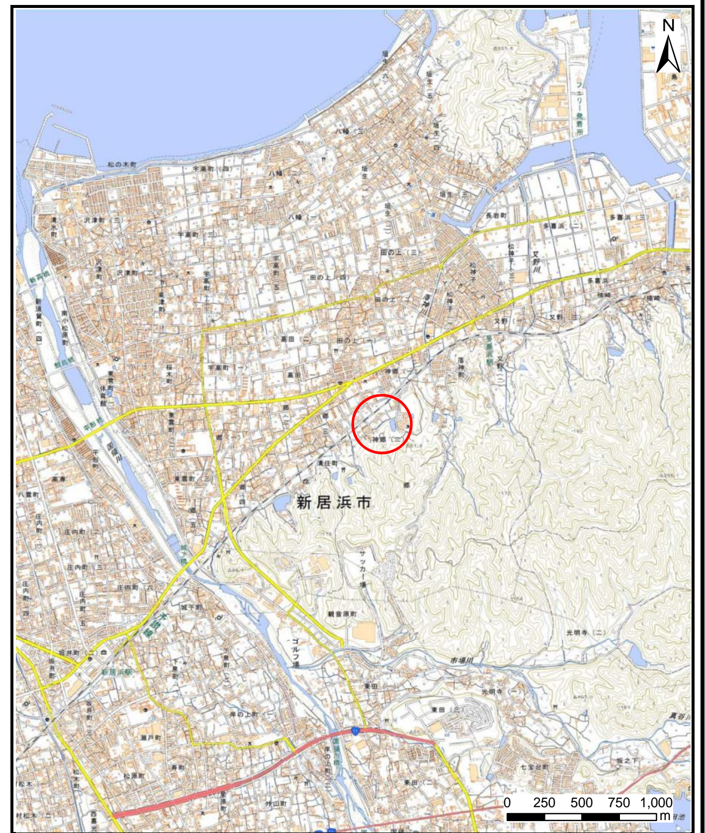
様式-1 (土) 土砂災害警戒区域・土砂災害特別警戒区域 位置図