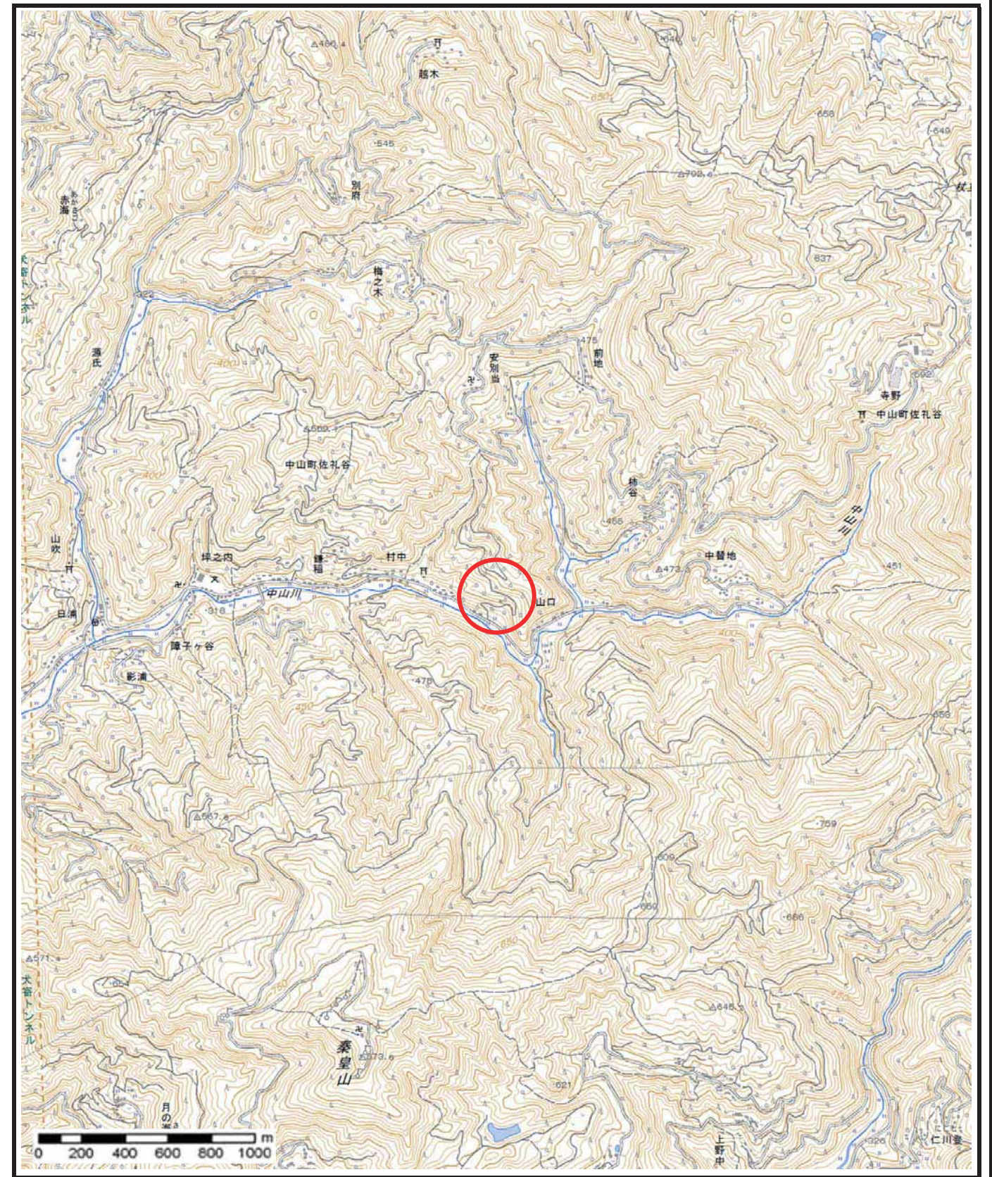
様式-1 (急) 土砂災害警戒区域・土砂災害特別警戒区域 位置図