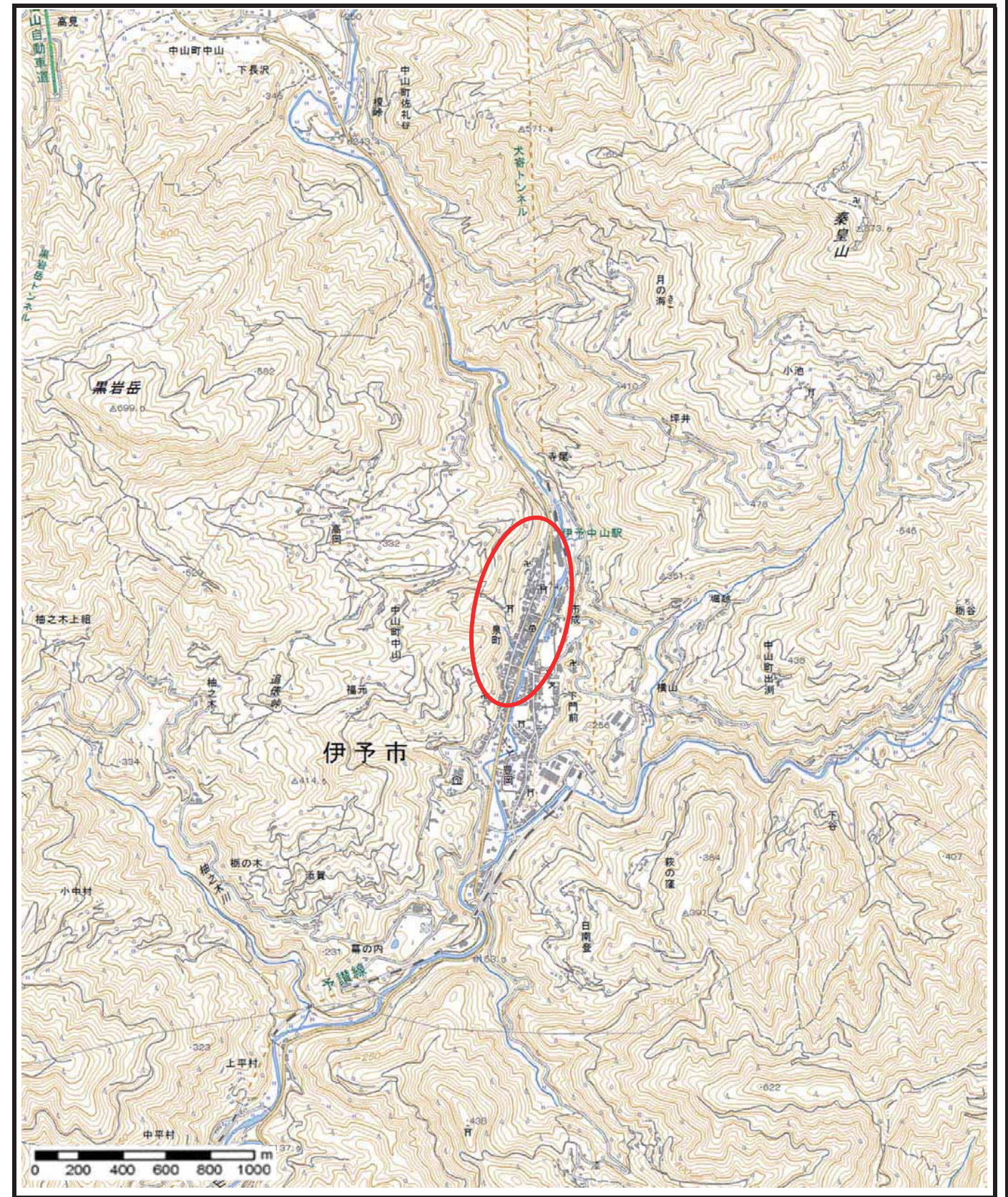
様式-1 (急) 土砂災害警戒区域・土砂災害特別警戒区域 位置図