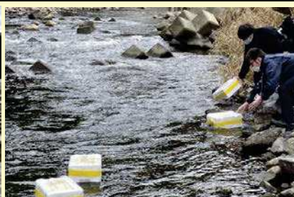
模擬ごみ投入：1月26日12時