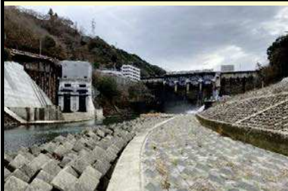
スタート地点：鹿野川ダム直下

愛媛県南予地方局大洲土木事務所管内図（承認番号平29情使,第689号、第805号承認番号平29情復,第805号）加筆