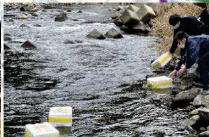
模擬ごみ投入：1月26日12時