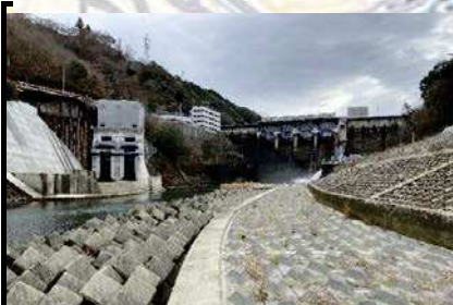
スタート地点：鹿野川ダム直下

愛媛県南予地方局大洲土木事務所管内図（承認番号平29情使,第689号、第805号承認番号平29情復,第805号）加筆