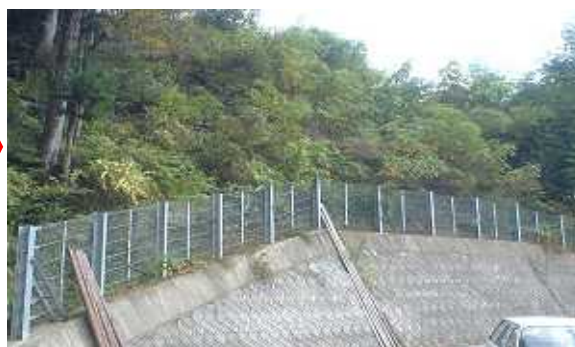
施工後4年7ヶ月経過