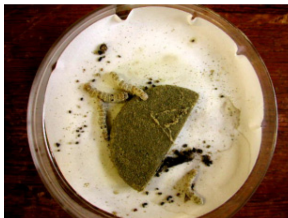
ユズ未熟果皮アセトン抽出物塗布