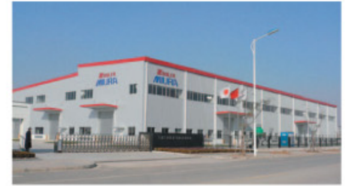
在中国苏州建设了工厂的爱媛县企业