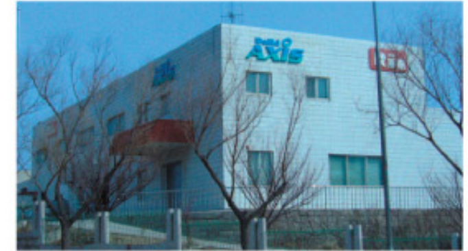
在中国大陆发展的爱媛县企业