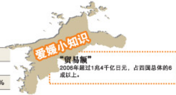
爱媛县的贸易额的变动