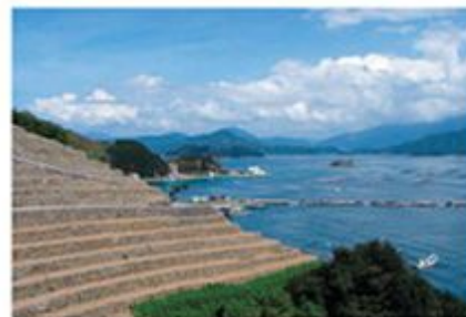
宇和海沿岸的梯田(古人名“静帆里天”)

爱媛气候温暖(县都所在地松山市的平均气温为16度),由很少有台风地震等自然灾害的濑户内海沿岸地区和受自南海过来的黑潮暖流惠的宇和海沿岸地区组成,自古以来物产丰饶、民风淳朴,有着企业运营和生活家居的最佳环境,即可以去挑战充满刺激的风帆冲浪等海上运动,也可以徒步去感受四季美景如画的大自然。另外这里还建有高尔夫球场和滑雪场,一年四季都可以享受各种体育运动和野外活动。