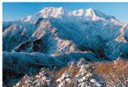
石钟山(西日本最高峰海拔1,982m,是山岳信仰的圣地)

面临濑户内海和宇和海,有平原、有盆地、有群山,也有河流和温泉等丰富多样的自然环境。人们称岛屿星罗棋布的濑户内海是东洋的爱琴海,已被指定为“濑户内海国立公园”。而拥有绵长的里阿斯式海岸的宇和海则被指定为“足摺宇和海国立公园”。四国的中央矗立着西日本最高峰石钟山及其群山和四国喀斯特石灰岩地貌高原。